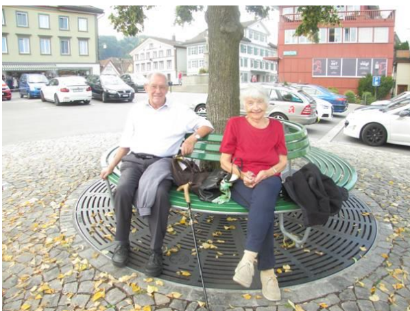
Zwei zufriedene Teilnehmer